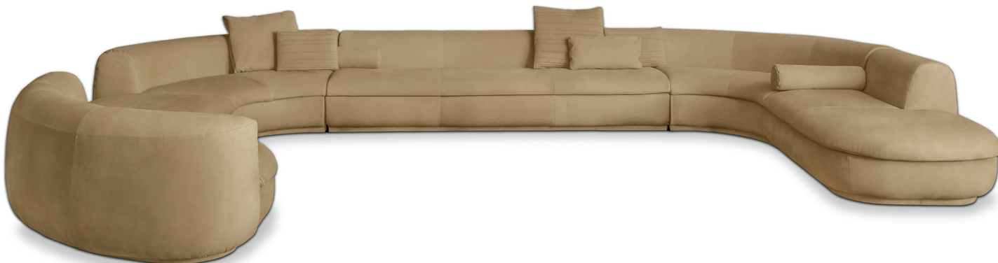
83 x 98, 145 x 98, 210 x 113, 255 x 98 | c. 26 x 55, 45 x 30, 55 x 55 | r. 60 Ø15 | Kashmir Corde

Modello componibile. Struttura in multistrato. Cuscineria di seduta e schienale in poliuretano espanso a densità differenziata con rivestimento in fibra acrilica. Molleggio a nastri elastici intrecciati di caucciù rivestito. Base sottoscocca rivestita in pelle.