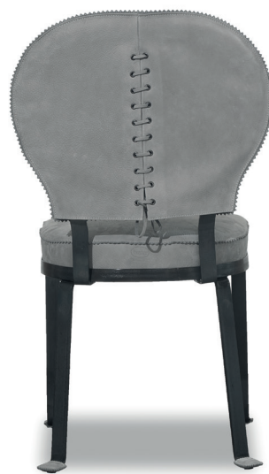
Nabuck Light Grey

Struttura in metallo forgiato nero con finitura con vernice trasparente opaca, con assemblaggio del piatto con bullette in metallo ribattuto. Cuscineria di seduta in poliuretano espanso a densità differenziata. Puntale del piedino in cuoio. Protezione antiossidante con vernice trasparente opaca; a richiesta è possibile avere la struttura verniciata con colore campione con un supplemento del 12% . Rivestimento con cuciture con motivo decorativo.