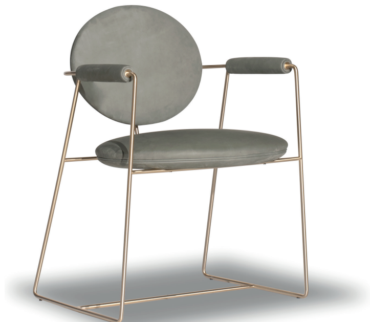
Kashmir Mousse | b. ottonata, brassed

Struttura in tondino di metallo da 1,2 cm, 1/2" ottonato satinato, brunito spazzolato a mano o nichelato satinato, con vernice opaca . Struttura seduta e schienale in multistrato di faggio, struttura braccioli in massello di faggio. Imbottitura in poliuretano espanso con rivestimento in fibra acrilica. Profilo decorativo nella medesima tonalità di cuoio. A richiesta è possibile realizzare seduta, schienale e braccioli con diverse tipologie di pelle o colore con un supplemento del 10% . Si ricorda che il prezzo viene determinato dalla pelle in categoria superiore.