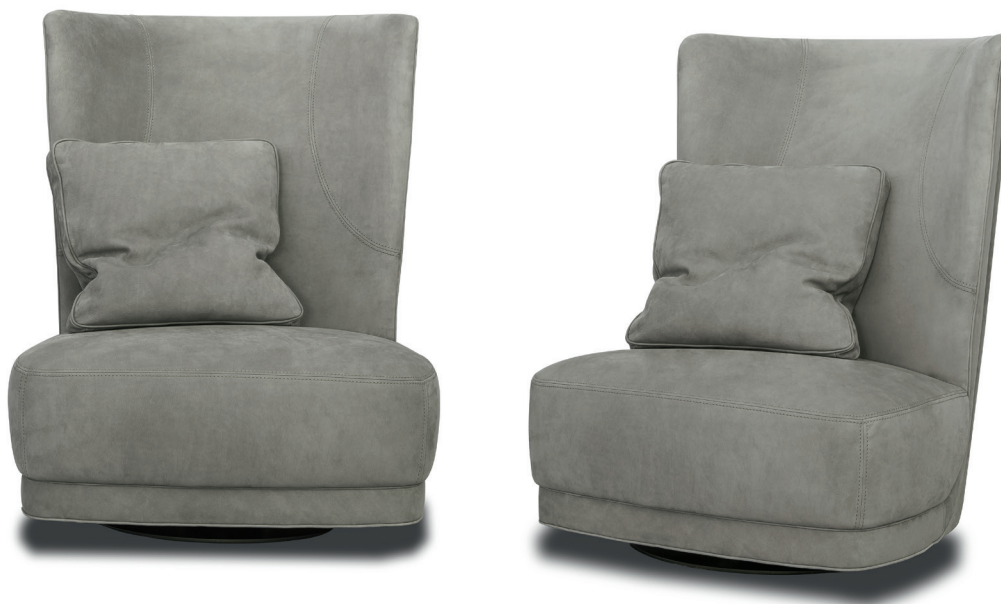
Kashmir Mousse | c. 50 x 50 Kashmir Mousse

Struttura di schienale in multistrato di pioppo curvato e di seduta in abete e faggio. Imbottitura in poliuretano espanso a densità differenziata. Doppio profilo decorativo. Base girevole in metallo verniciato nero opaco.