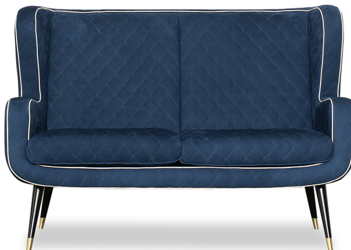
Nabuck Blue | p. Kashmir Nuage