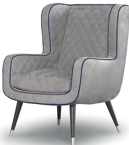
Kashmir Nuage | p. Nabuck Blue