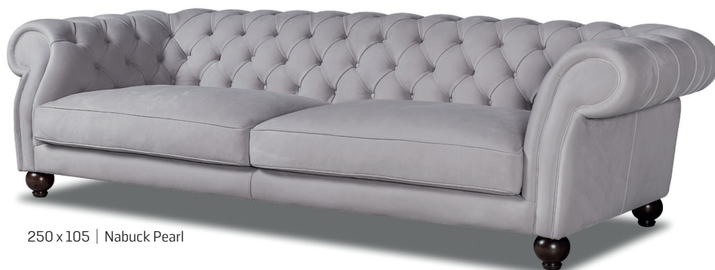
250 x 105 | Nabuck Pearl