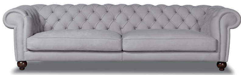
250 x 105 | Nabuck Pearl