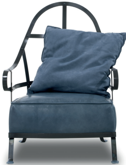
Tuscany Viareggio | c. Kashmir Saphir