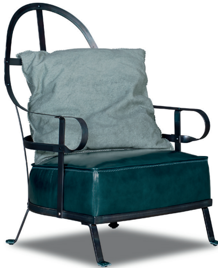
Tuscany Cortona | c. Bo.Hemian Nympha

Struttura in metallo nero forgiato, piatto e angolare con assemblaggio del piatto con bullette in metallo ribattuto. Protezione antiossidante con vernice trasparente opaca. Cuscineria di seduta in poliuretano espanso a densità differenziata. Cuscino di schienale in piuma d'oca lavata e sterilizzata. Rivestimento con cuciture con motivo decorativo. Puntale del piedino in cuoio.