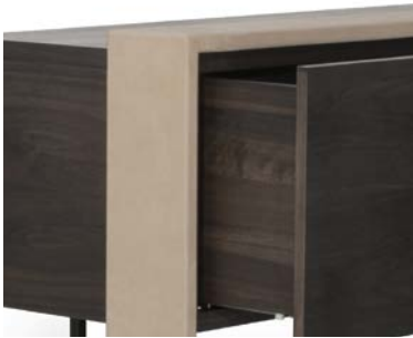
244 x 50 | Nabuck Sable